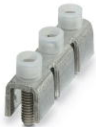
Feste Brücke, Rastermaß: 20 mm, Polzahl: 3, Farbe: silberfarben

Bitte beachten Sie, dass die hier angegebenen Daten dem Online-Katalog entnommen sind. Die vollständigen Informationen und Daten entnehmen Sie bitte der Anwenderdokumentation. Es gelten die Allgemeinen Nutzungsbedingungen für Internet-Downloads. ( http://phoenixcontact.de/download )