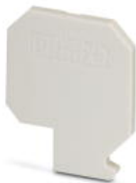
Abschlussdeckel, Länge: 38 mm, Breite: 4,2 mm, Farbe: grau, Isolationsstoff: Keramik

Bitte beachten Sie, dass die hier angegebenen Daten dem Online-Katalog entnommen sind. Die vollständigen Informationen und Daten entnehmen Sie bitte der Anwenderdokumentation. Es gelten die Allgemeinen Nutzungsbedingungen für Internet-Downloads. ( http://phoenixcontact.de/download )