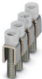
Feste Brücke, Rastermaß: 8 mm, Polzahl: 4, Farbe: silberfarben

Bitte beachten Sie, dass die hier angegebenen Daten dem Online-Katalog entnommen sind. Die vollständigen Informationen und Daten entnehmen Sie bitte der Anwenderdokumentation. Es gelten die Allgemeinen Nutzungsbedingungen für Internet-Downloads. ( http://phoenixcontact.de/download )