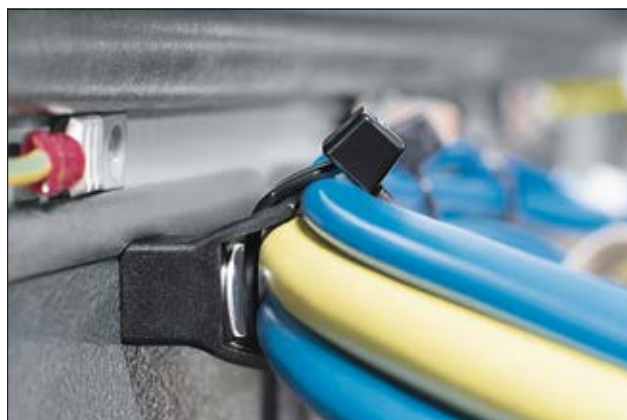
LOK02 Befestigungssockel für schwereres Bündelgut.